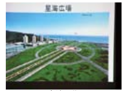
発展する大連を紹介